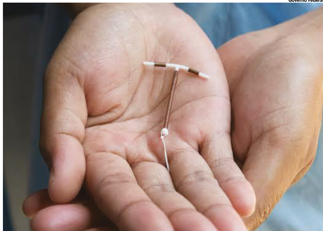
Mastologista afirma que a remoção do DIU não compromete a fertilidade, ou seja, há possibilidade de engravidar