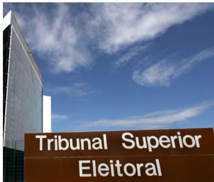
TSE: dúvidas sobre regras para utilização das redes sociais durante as eleições de 2024