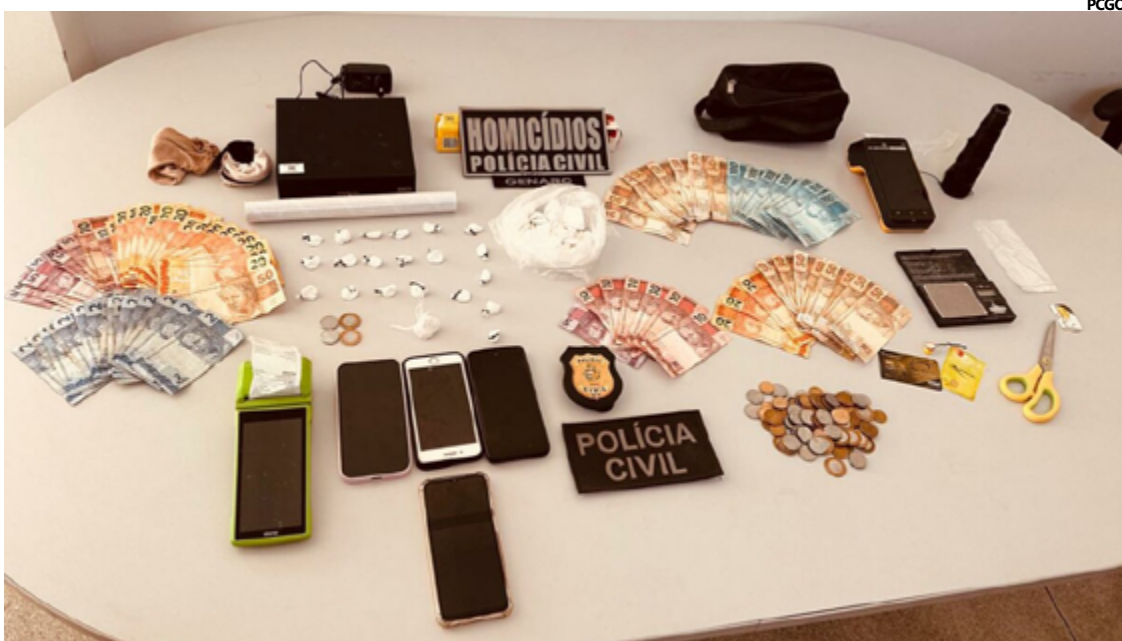
Foram apreendidos vários itens que confirmam a prática do tráfico, como balanças de precisão, tesouras, rolos de papel-filme e uma soma em dinheiro

A investigação começou após uma denúncia anônima que levou a equipe policial a monitorar as atividades de um casal no bairro Grande Vale, em Novo Gama. Os suspeitos, de 31 e 28 anos, utilizavam sua mercearia como fachada para a venda