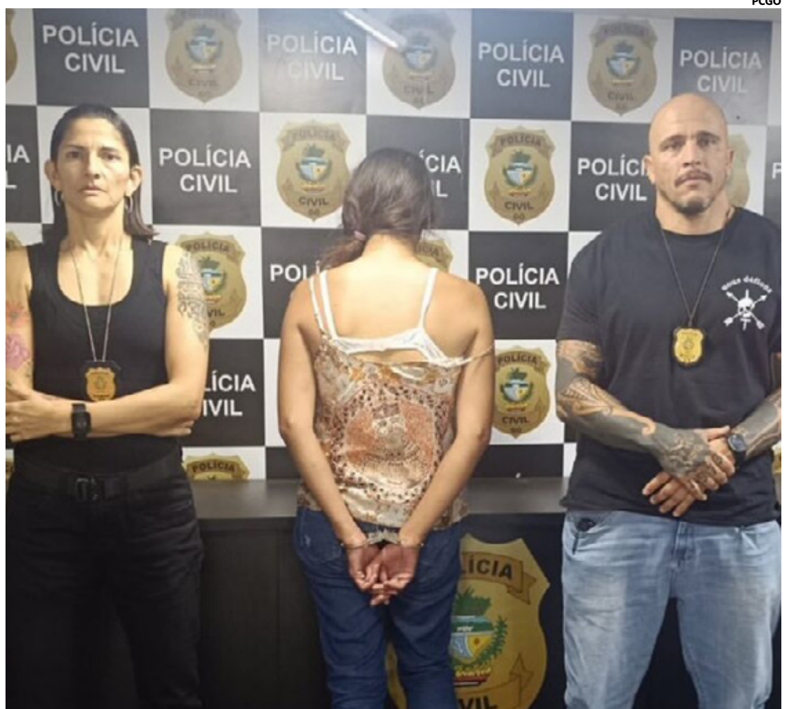
A Polícia Civil foi acionada pelo Serviço de Verificação de Óbito do Instituto Médico Legal (IML), que havia removido o corpo do bebê

Os órgãos de proteção à infância reforçam a importância de uma rede de apoio robusta para as famílias, oferecendo recursos e assistência para prevenir situações de violência doméstica. Instituições de saúde, escolas e serviços sociais são incentivados a trabalhar em conjunto para identificar e intervir em casos potenciais de abuso o mais cedo possível.