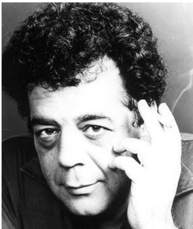
Jornalista começou carreira no “Jornal do Brasil”