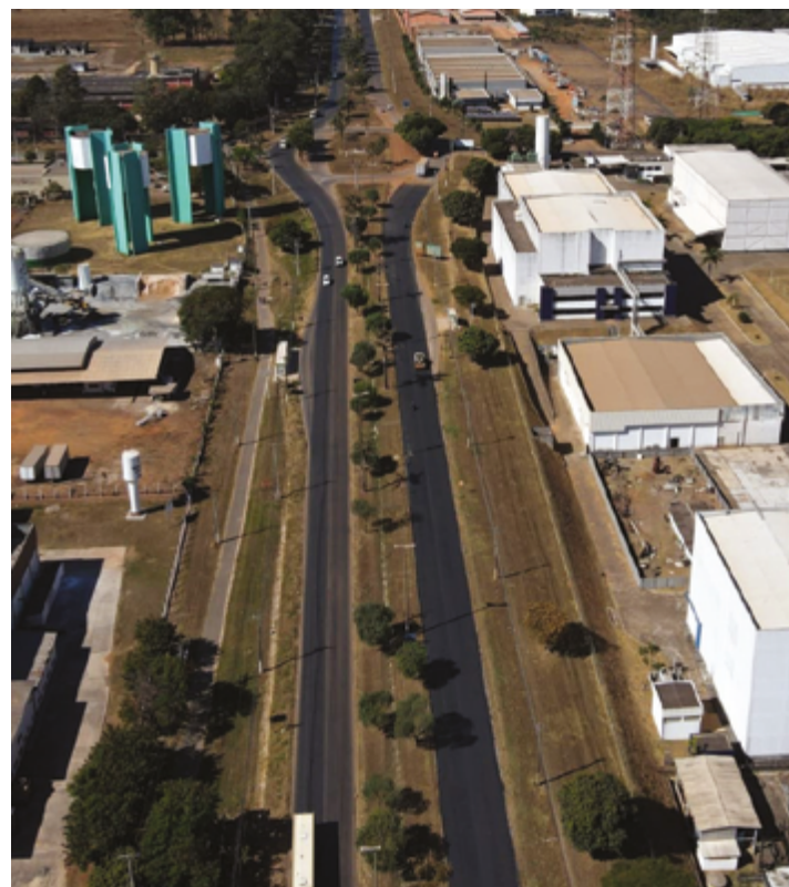
Números de maio marcam o 13º aumento consecutivo da indústria goiana, o que leva a uma variação acumulada no ano e em 12 meses de 10,2%