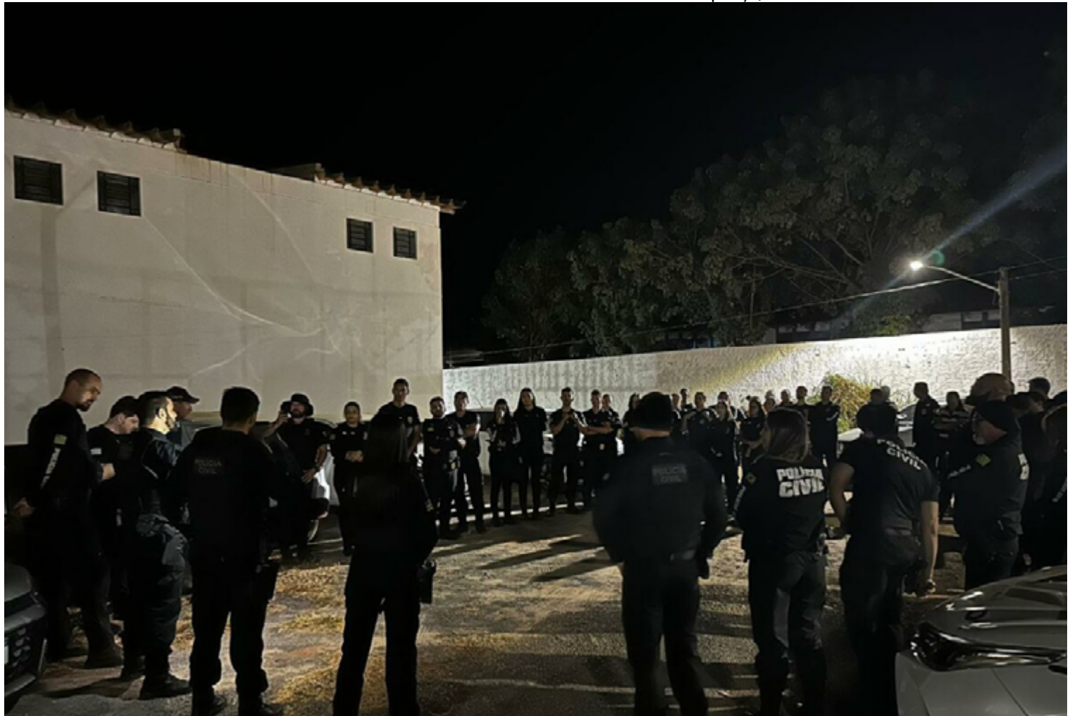
A ação resultou no cumprimento de diversos mandados judiciais de busca e apreensão contra suspeitos

Durante a operação, um indivíduo foi preso em flagrante com uma quantidade significativa de drogas em sua posse, incluindo maconha, comprimidos de ecstasy, envelopes de MDMA, e outras substâncias sintéticas. As autoridades informaram que o traficante preso utilizava o recurso de "status" do WhatsApp para anunciar a chegada de novas remessas de drogas, facilitando assim a comunicação com os consumidores.