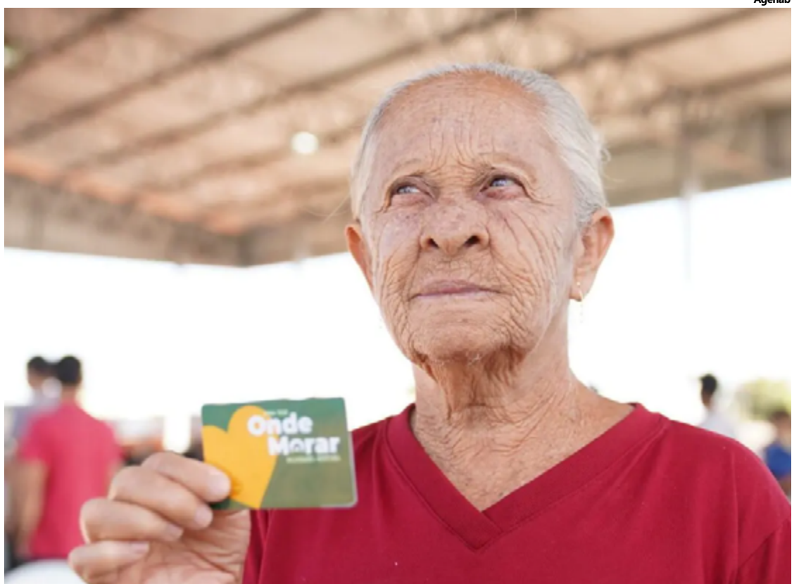
Desde 2021, quando teve início o programa Aluguel Social, já foram entregues quase 60 mil cartões, distribuídos em 99 municípios

“São milhares de famílias que ainda estão na fila de espera por um programa de casa própria que atenda suas necessidades, e seguem sufocadas pelo peso do aluguel enquanto isso”, alinhava Sales.