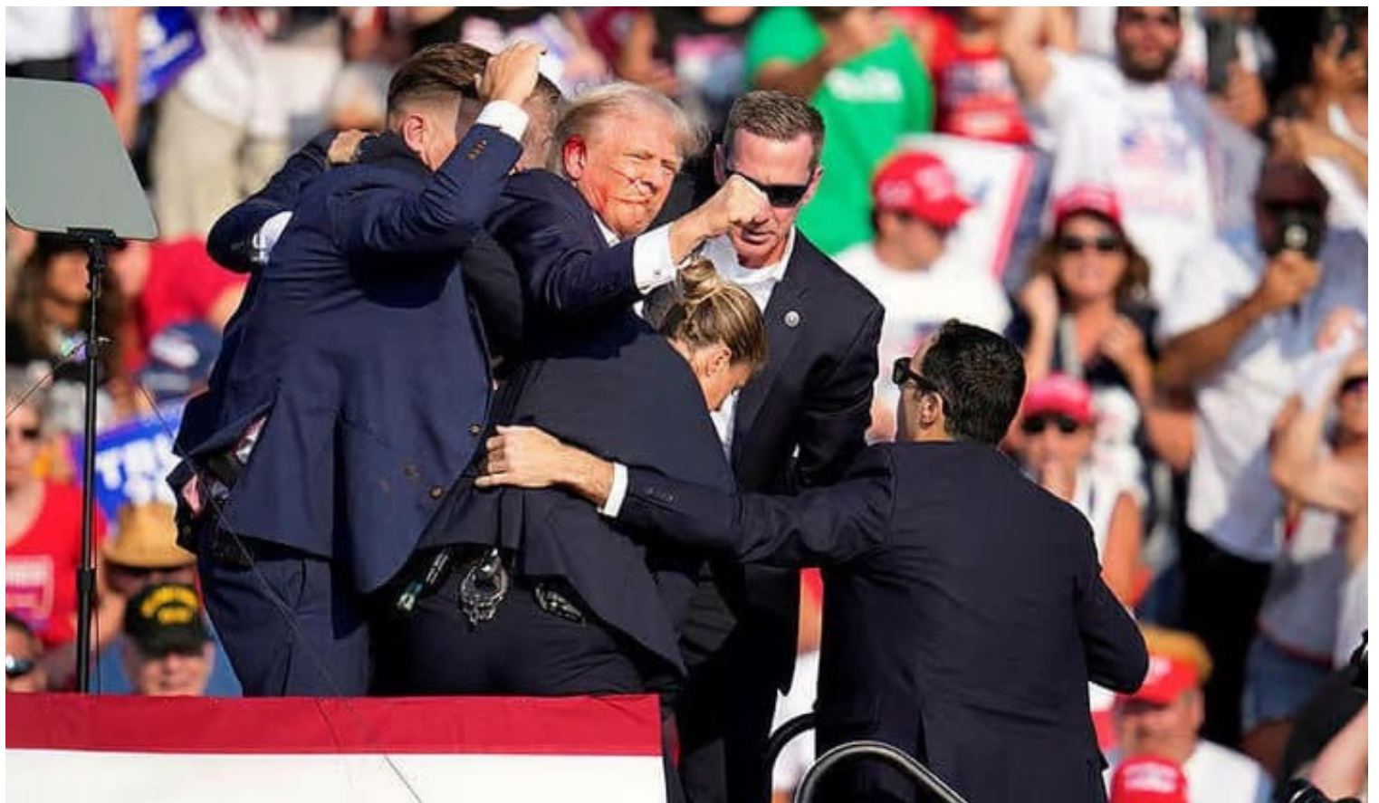
Trump foi rapidamente retirado do local, com sangue visível ao redor da orelha direita, e levado a um hospital, recebendo alta horas depois

High School em 2022, Crooks estava registrado como eleitor republicano, embora registros mostrem uma pequena doação de US$ 15 para um comitê de ação política alinhado aos democratas em janeiro de 2021. Sem antecedentes criminais conhecidos, o motivo do ataque ainda é desconhecido. O FBI confirmou sua identidade através de testes de DNA e biometria, já que Crooks não portava documentos no momento do atentado.