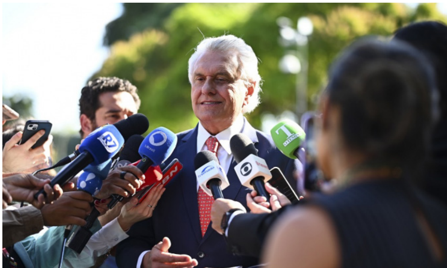
Ronaldo Caiado: busca de amplo apoio para concorrer, pela segunda vez, ao Palácio do Planalto

O governador diz que não descarta a possibilidade de Bolsonaro reverter sua inelegibilidade e de concorrer ao próximo pleito presidencial, mas diz que, caso essa hipótese não se confirme, suas credenciais