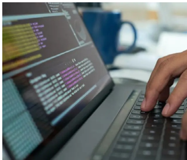
Em Goiás, setor de serviços cresceu acima da média nacional no recorte dos últimos 12 meses

A Pesquisa Mensal de Serviços (PMS), do IBGE, produz indicadores que permitem acompanhar o comportamento conjuntural do setor de serviços no país, investigando a receita bruta de serviços nas empresas formalmente constituídas, com 20 ou mais pessoas ocupadas, que desempenham como principal atividade um serviço não financeiro, excluídas as áreas de saúde e educação.