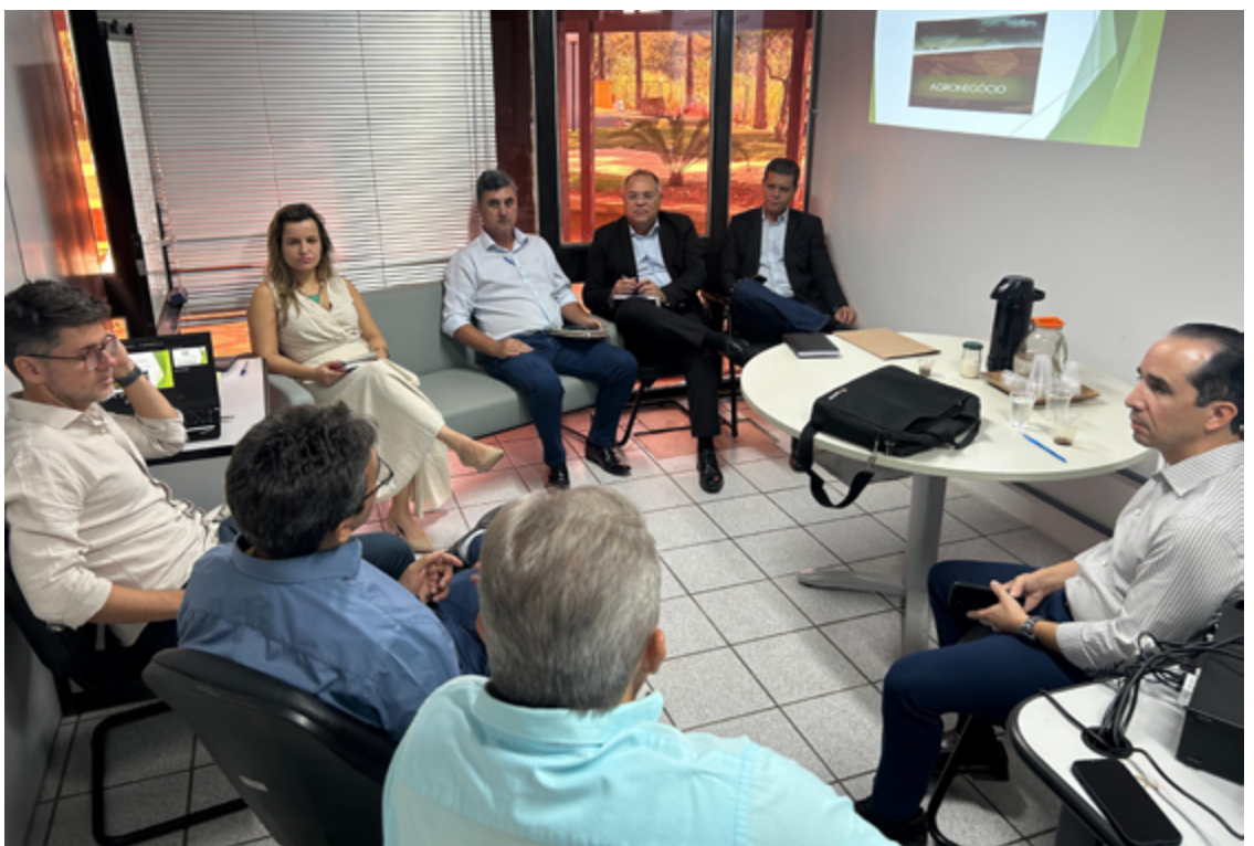
O plano foi discutido em uma reunião na última semana, na sede da Secretaria da Economia

A nova estrutura de fiscalização proposta pela Receita Estadual de Goiás é uma resposta direta às complexidades do setor agropecuário, que representa uma parte significativa da economia estadual. A segmentação das operações por tipo de produto e fraudes específicas