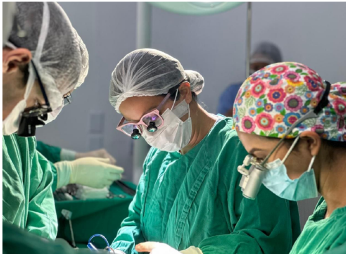
Cirurgias de urgência e emergência na unidade de saúde tiveram aumento de 100% desde 2021

O HEF tem registrado ainda um aumento significativo nas cirurgias de urgência e emergência ao longo dos anos. Em 2021, foram realizadas 673