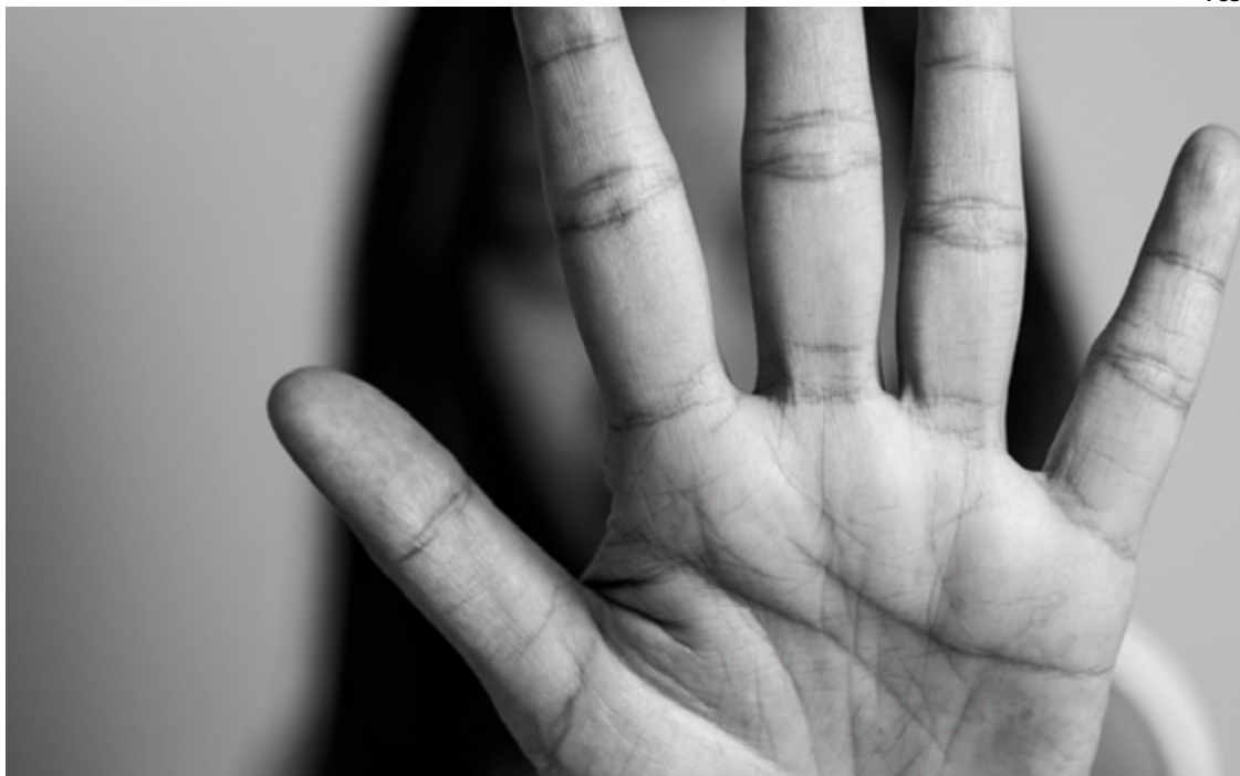
O suspeito se envolveu em uma discussão com a ex-companheira e a agrediu fisicamente com socos e pontapés

No entanto, apesar da medida protetiva, em 2 de julho, o