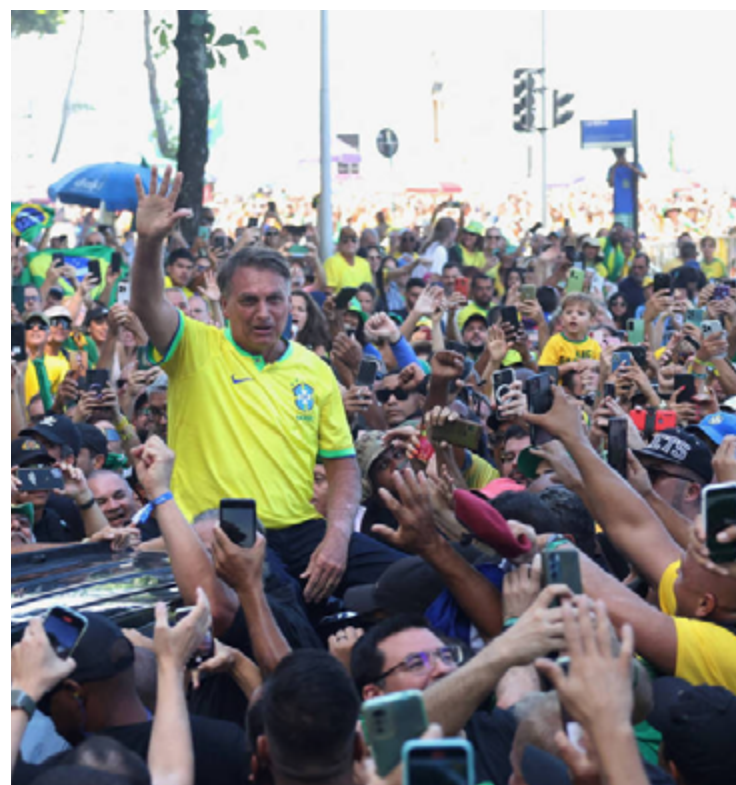
Jair Bolsonaro: visita aos municípios para reforçar pré-campanha do PL